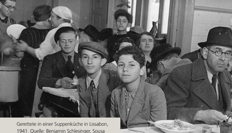
Gerettete in einer Suppenküche in Lissabon, 1941.

In der Abendveranstaltung geht es um in der Geschichte und in der Gegenwart brennende Fragen. Woher kam dieser Mut? Welche Entscheidungsprozesse fanden statt? Warum begeben sich auch heute Menschen in Gefahr, um unmenschliche Regime und totalitäre Strukturen zu bekämpfen oder Verfolgten und Geflüchteten zu helfen?