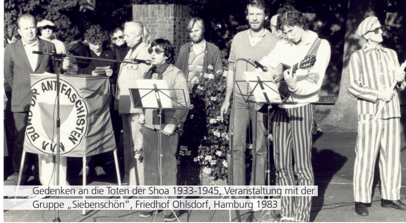
Gedenken an die Toten der Shoah 1933-1945, Veranstaltung mit der Gruppe „Siebensön“, Friedhof Ohlsdorf, Hamburg 1983