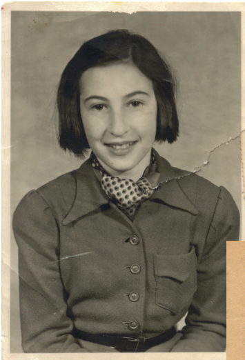
Esther Bejarano mit 14 Jahren, 1938