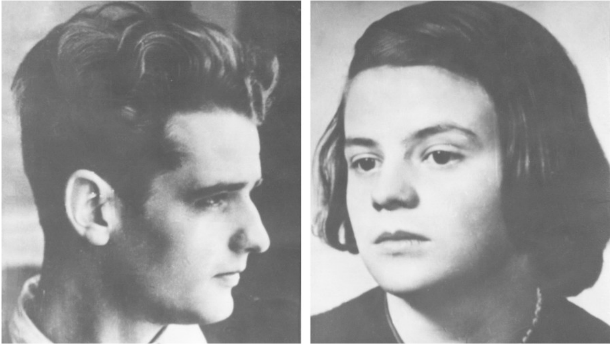
Im Ulmer Stadtarchiv werden Flugblätter der „Weißen Rose“ aufbewahrt. Sie wurden Hans und Sophie Scholl zum Verhängnis.